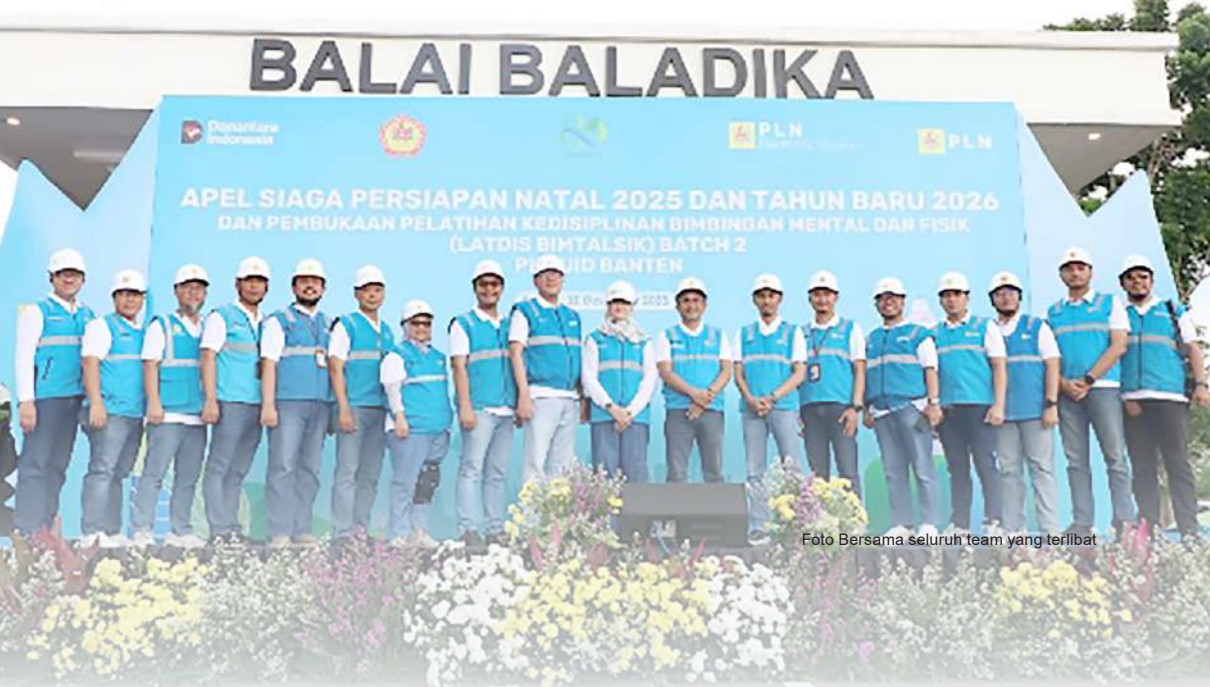
Foto Bersama seluruh team yang terlibat