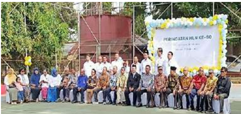
Ketua IKPLN Cabang Merauke bersama para senior sesepuh IKPLN Cabang Merauke bergambar bersama Manajer PT PLN (Persero) UP3 Merauke usai mengikuti Upacara memperingati Harlisnas ke – 80 tgl 27 Oktober 2025.