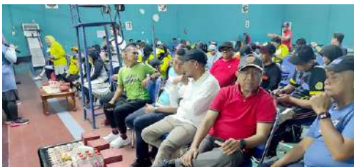
Mengikuti acara Olah Raga Jumat Pagi bersama sekaligus peresmian Lapangan PADEL oleh GM PT PLN (Persero) Sulselrabar dan Ketua IKPLN Daerah Sulselrabar.