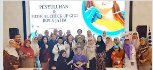
Kegiatan Penyuluhan & Medical Check Up Gigi gratis secara berkala yang diadakan oleh IKPLN Cab Surabaya Utara tgl 02 Nopember 2025.