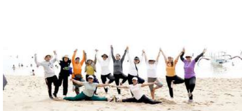
Ibu – Ibu IKPLN daerah Bali melakukan Jalan Santai menyusuri Pantai Indah Sanur – Bali.