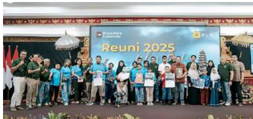
Kegiatan Reuni 2025 alumni Pejabat yang pernah bertugas di Bali yang diadakan oleh IKPLN Daerah Bali bekerjasama dengan PT PLN (Persero) UID Bali tgl 6 – 7 Desember 2025 yang dihadiri oleh Ketua IKPLN Pusat Bpk Syamsul Huda, memberikan Sumbangan kepada anak2 yang kurang beruntung dan penderita autis.