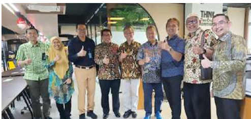
Pengurus YBM PLN Pengurus IKPLN bergambar bersama usai pertemuan.