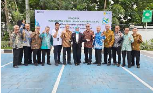
Pengurus IKPLN Daerah NTB usai mengikuti upacara dalam rangka HLN ke 80 tgl 27 Oktober 2025.