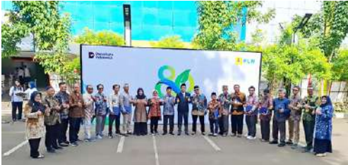
Pennngurs IKPLN Daerah Banten dan Pengurus IKPLN Cabang Tangerang mengikuti Upacara Bendera di halaman Kantor PT PLN (Persero) UID Banten dalam rangka memperingati Hari Listrik Nasional ke – 80.