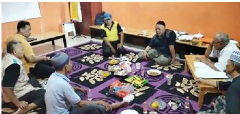
Rapat Pengurus IKPLN Cabang UID Banten tgl 06 Desember 2025, membahas Hunian Sehat tahun 2026.