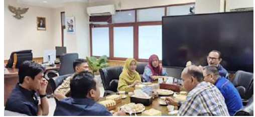
Pengurus IKPLN Daerah S2JB pada tgl 07 Oktober 2025 melakukan Audiensi dan Silaturahmi kepada General Manager PT PLN (Persero) UID S2JB selaku Pembina Utama, untuk melaporkan kegiatan yang sudah berjalan serta Program Kerja kedepan.