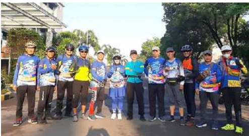
Kegiatan Gowes bersama Pengurus dan Anggota IKPLN Daerah NP di Surabaya tgl 02 Nopember 2025.