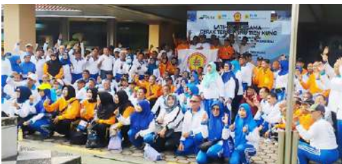
Pengurus dan Anggota IKPLN daerah Transmisi Jawa Timur ikut bergabung dalam Latihan bersama Gerak Terapi LING TIEN KUNG bersama Komunitas Olah Sehat Ling Tien Kung IKPLN se Jawa Timur tgl 25 Oktober 2025.