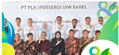
Pengurus IKPLN Daerah Babel menghadiri acara Syukuran dan Ramah Tamah dengan GM PT PLN (Persero) UIW Babel beserta Jajaran Manajemen dalam rangka HLN ke - 80 tgl 27 Oktober 2025.