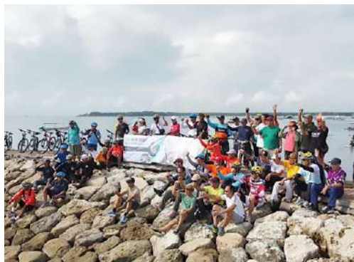
Para peserta Reuni melakukan kegiatan _"Bersepeda Gembara Ria"_ menyusuri Pantai Sanur Bali tgl 07 Desember 2025.