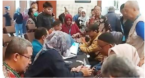
Bertempat di Kantor PT PLN (Persero) UIT JBT dilakukan perekaman Finger Print Anggota IKPLN Cabang UPT Bandung dan UP2B Jabar untuk Update Aplikasi New PLN Sehat.