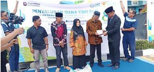
Pada tgl 27 Oktober 2025, dalam rangka memperingati Harlisnas, YBM PLN memberikan santunan kepada anggota IKPLN Cabang Dumai yang berhak menerimanya.