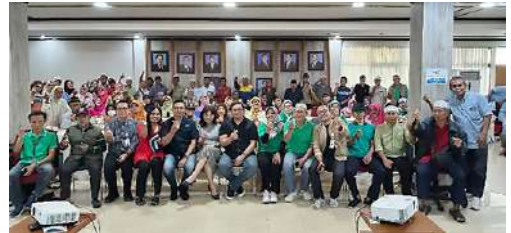
Health Talk dengan Tema "Minimally Invasive Treatment Neurosurgery" dilaksanakan tgl 29 Nopember 2025 oleh IKPLN Cabang UP3 Bulungan bekerjasama dengan RS Mayapada Lebak Bulus.