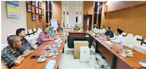
Pengurus IKPLN daerah Riau & Kepri pada tgl 09 Desember 2025 melakukan Audiensi dan Silaturahmi kepada General Manager PT PLN (Persero) UID Riau dan Kepri selaku Pembina Utama, untuk melaporkan kegiatan yang sudah berjalan serta Program Kerja kedepan.