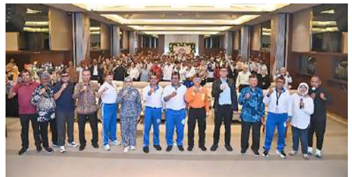
Acara Temu Kangen Purnakarya PLN Indonesia Power Kantor Pusat dan Rakor IKPLN Daerah Indonesia yang diikuti lebih dari 150 orang peserta menjadi ajang Silaturahmi serta memperkuat koordinasi.