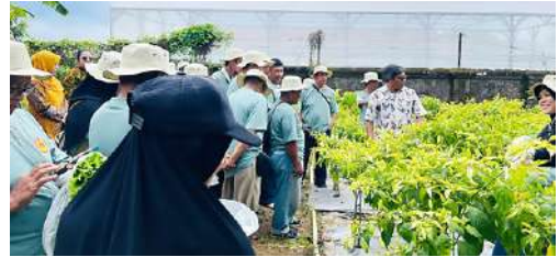
Peserta Pelatihan Non Ketenagalistrikan bidang Hidroponik atas Kerjasama IKPLN Daerah Jateng & DIY dengan Balai Latihan Kerja & Transmigrasi Provinsi Jawa Tengah, diselenggarakan di Cilacap tgl 13 Desember 2025.