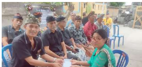
Pengurus IKPLN Cabang Bali Utara melayat ke Rumah Duka salah satu anggota yang meninggal dunia sekaligus menyampaikan Uang Duka kepada Keluarga yang sedang berduka.