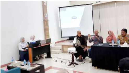
Suasana Pelaksanaan Musyawarah Cabang IKPLN Cabang Bima.