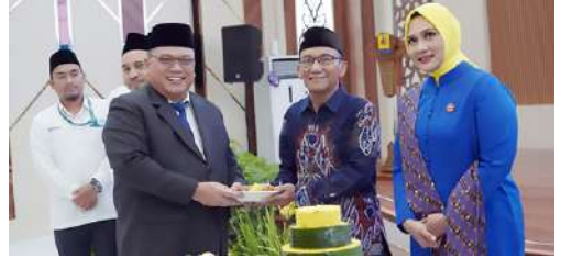
Ketua dan Pengurus IKPLN Daerah Kalimantan Selatan dan Kalimantan Tengah turut hadir mengikuti acara Harlisnas di Kantor PT PLN (Persero) UID Kalimantan Selatan dan Kalimantan Tengah tgl 27 Oktober 2025