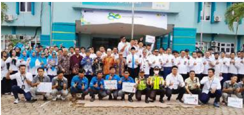
Pengurus IKPLN Cabang Berau usai mengikuti Upacara HLN ke – 80 di halaman Kantor PT PLN (Persero) UP3 Berau tgl 27 Oktober 2025.