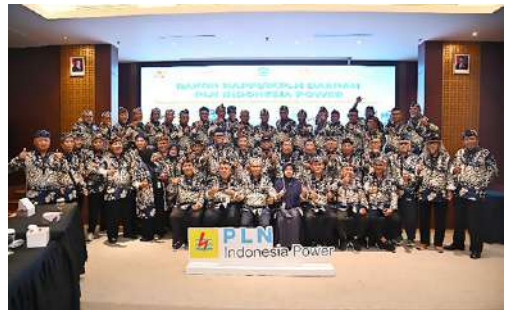
Peserta acara Rapat Koordinasi (Rakor) Himpunan Alumni Pegawai Pembangkitan PLN (HAPPI) / IKPLN Daerah Indonesia Power hari Sabtu tgl 13 Desember 2025.