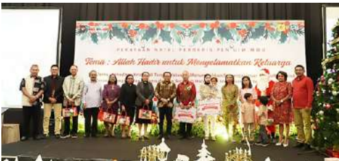
Ketua dan Pengurus IKPLN Daerah Maluku dan Maluku Utara merayakan Natal Bersama dengan GM PT PLN (Persero) Maluku dan Maluku Utara beserta para Manajer.