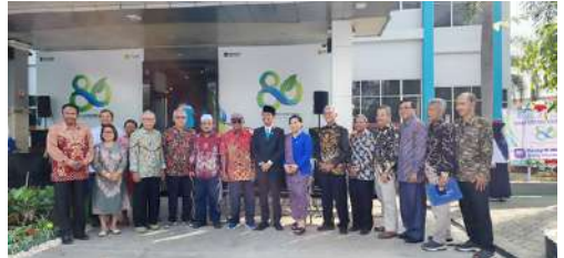
Anggota dan Pengurus IKPLN Cabang Flores Bagian Barat melaksanakan Syukuran Harlisnas ke – 80 tgl 27 Oktober 2025 di Kantor PT PLN (Persero) ULP Ende.