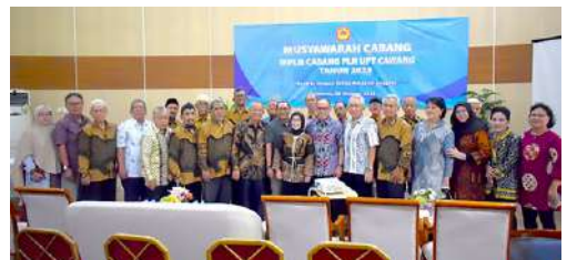
Musyawarah Cabang IKPLN Cabang UPT Cawang dilaksanakan tgl 08 Oktober 2025, untuk menyampaikan pertanggung jawaban serta memilih ketua Masa Bakti 2025 - 2029.