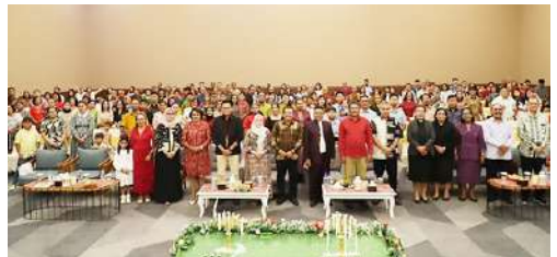
Suasana Hidmat Ibadah Natal Bersama yang diikuti oleh Pegawai dan Pensiunan PT PLN (Persero) UIW Maluku dan Maluku Utara.