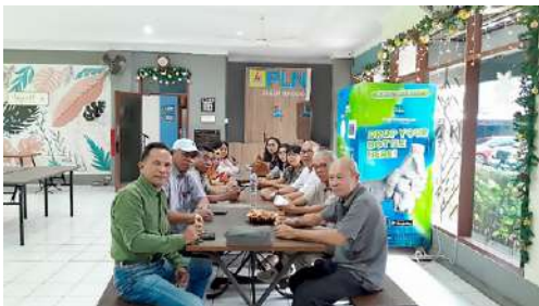
Rapat Panitia Natal 2025 IKPLN Daerah Sulutenggo.