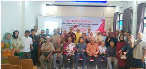
Musyawah Cabang IKPLN Cab Kantor UID Kalimantan Barat dan IKPLN Cab Pontianak dan Penggantian Pengurus Masa bakti 2025 – 2029.