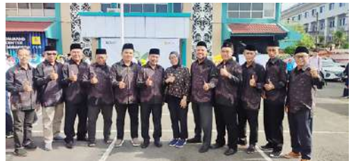
Pengurus IKPLN Cabang Samarinda usai mengikuti Upacara HLN ke – 80 di halaman Kantor PT PLN (Persero) UP3 Samarinda tgl 27 Oktober 2025.