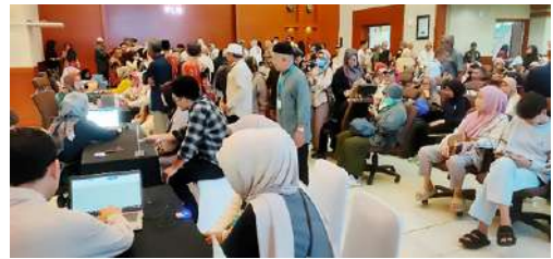
Perekaman Finger Print diikuti oleh lebih dari 600 orang pensiunan beserta keluarga yang masih ditanggung. Acara tersebut sekaligus sebagai ajang silaturahmi antar sesama pensiunan yang sudah lama tidak bertemu.