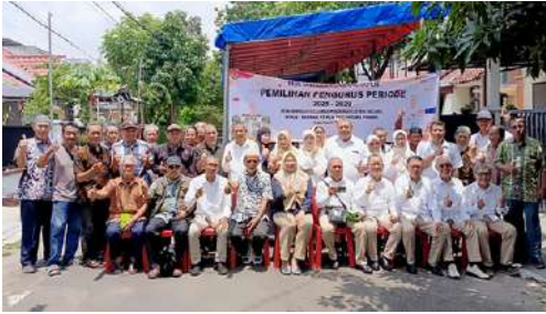
Musyawaharah Cabang IKPLN Cabang Muara Tawar yang dilaksanakan pada tgl 07 Nopember 2025 untuk memilih Pengurus baru serta Menyusun Program Kerja Pengurus Masa Bakti 2025 – 2029.