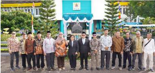
Pengurus IKPLN Daerah Kalimantan Barat turut hadir mengikuti Upacara Harlisnas di Kantor PT PLN (Persero) UID Kalimantan Barat tgl 27 Oktober 2025.