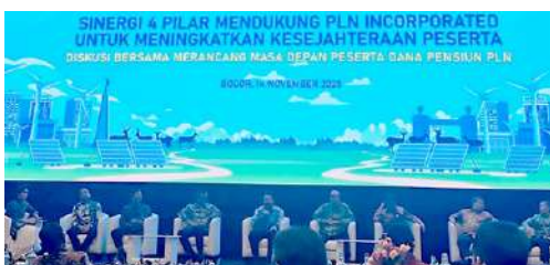
Peserta Diskusi 4 Pilar dari Dana Pensiun PLN, IKPLN, YPK PLN dan PT PLN (Persero).