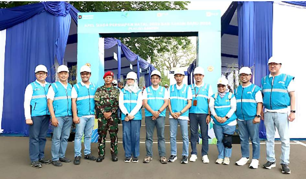
Pelatih Fisik dan Mental dari Kopassus Group 1 Serang, berfoto dengan GM UID Bantem dan staf, Dirut PLN ES dan Staf dan Dirut IKAMAS.

Sinergi ini akhirnya tidak hanya menghasilkan peningkatan kompetensi, tetapi juga melahirkan rasa percaya, kebanggaan, dan optimisme. Dengan dukungan IKAMAS yang berakar kuat pada pengalaman dan terjun langsung dalam dinamika kelistrikan PLN ES dan UID Banten melangkah semakin pasti menuju layanan distribusi yang unggul, andal, dan siap menghadapi tantangan masa depan.