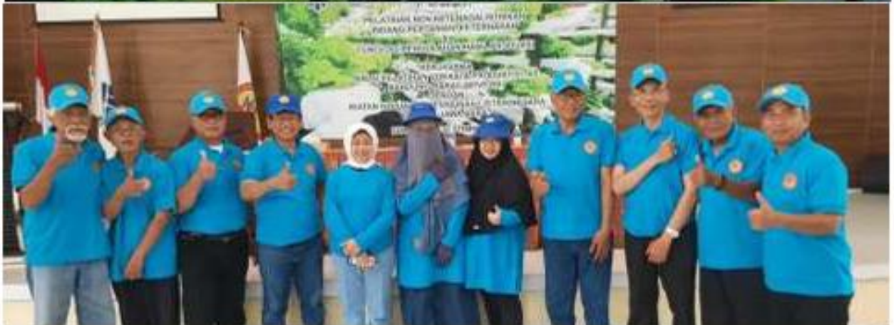
Peserta Pelatihan IKPLN Cabang Cianjur foto bersama dengan Ketua dan Sekjen IKPLN Daerah Jawa Barat