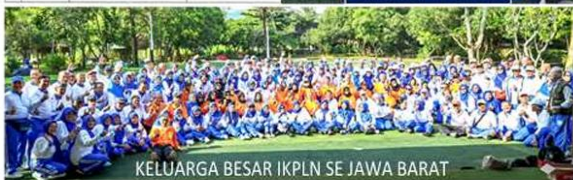
KELUARGA BESAR IKPLN SE JAWA BARAT