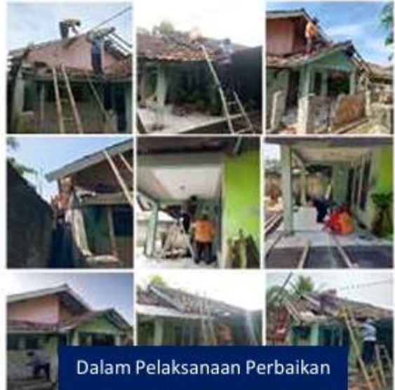
Dalam Pelaksanaan Perbaikan

Semoga bagi pemilik rumah Sehat bisa membuat rasa aman dan nyaman, bahagia dan penuh keberkahan, Aamiin Yaa Robbal' allamiin.