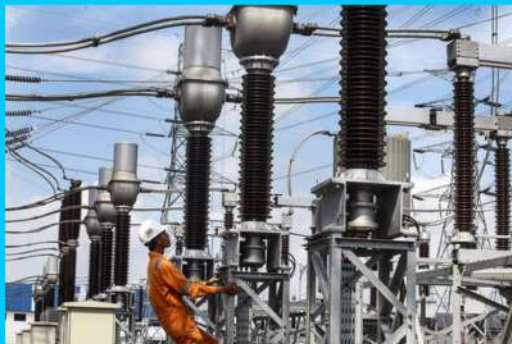
Gardu Induk Maulafa kapasitas 2x30 MVA