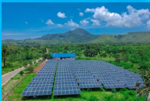
PLTS Oelpuah Kupang-NTT kapasitas 5 MWp

Bersama 4 Pilar Melayani, Memberdayakan dan Meningkatkan Kesejahteraan Anggota