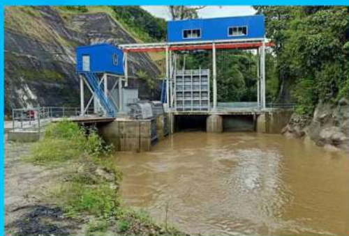
PLTM Wae Lega Kabupaten Manggarai - NTT Kapasitas 1,75 MW