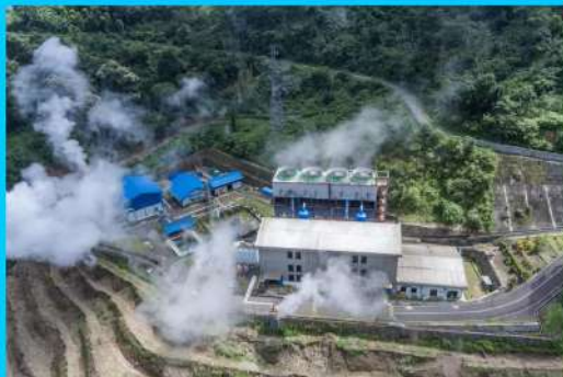
PLTP Ulumbu Kabupaten Manggarai kapasitas 10 MW (4x2,5 MW)